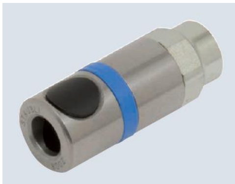
Figura 2. Enchufe rápido RCS06 Staübli o equivalente con tecnología antilatigazo.

Cualquier necesidad de salirse de estos requerimientos deberá ser sometida a aprobación por parte de Metro de Madrid, mediante la provisión de un informe justificativo en el que también se indiquen las alternativas.